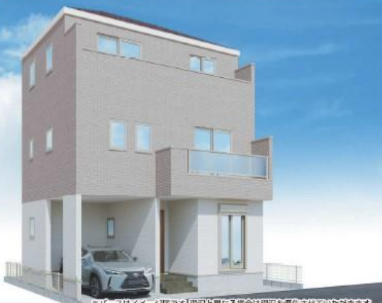
※パースはイメージ画です。現況と異なる場合は現況を優先させていただきます。

内装イメージ(スマート) パースはイメージ画です。現況と異なる場合は現況を優先させていただきます。